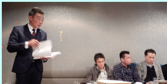
四万温泉特別合宿で課題を発表する5期生