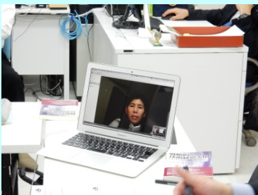
ネットで講義に参加